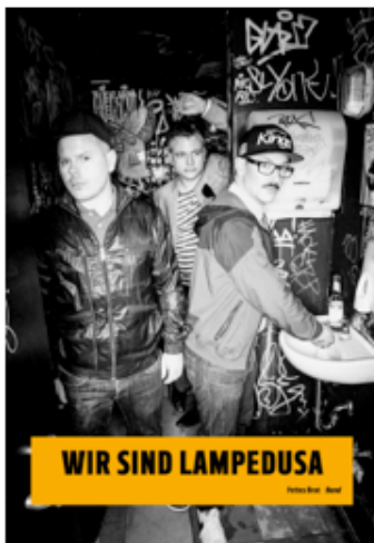
Fettes Brot, Band © Wir sind Lampedusa