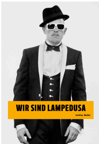
Jan Delay, Musiker

Seit mehr als einem halben Jahr leben rund 300 Flüchtlinge in Hamburg unter schwierigsten Umständen. Vom Senat gibt es weder Bleiberecht noch humanitäre Hilfe. Hamburgs Kreative wollen das ändern.