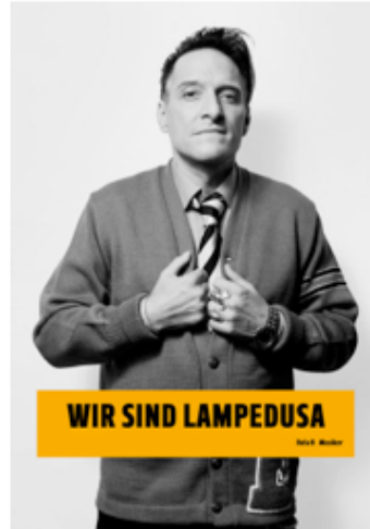
Bela B, Musiker